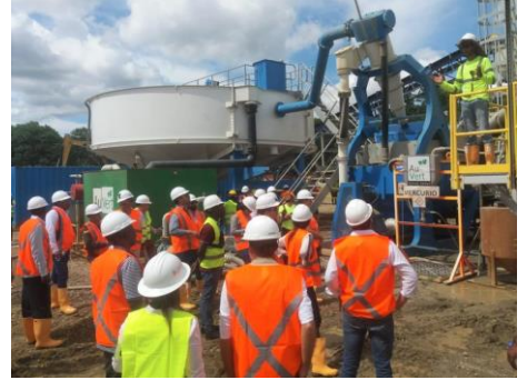
Proyecto Condoto - Nóvita