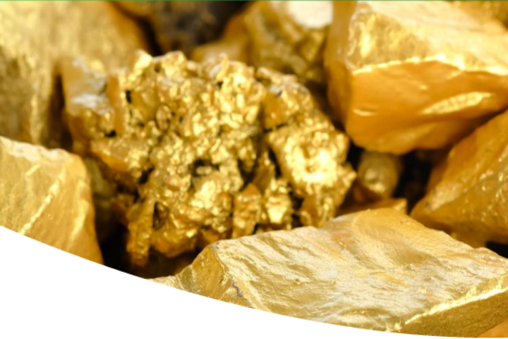
Chocó Condoto y Nóvita